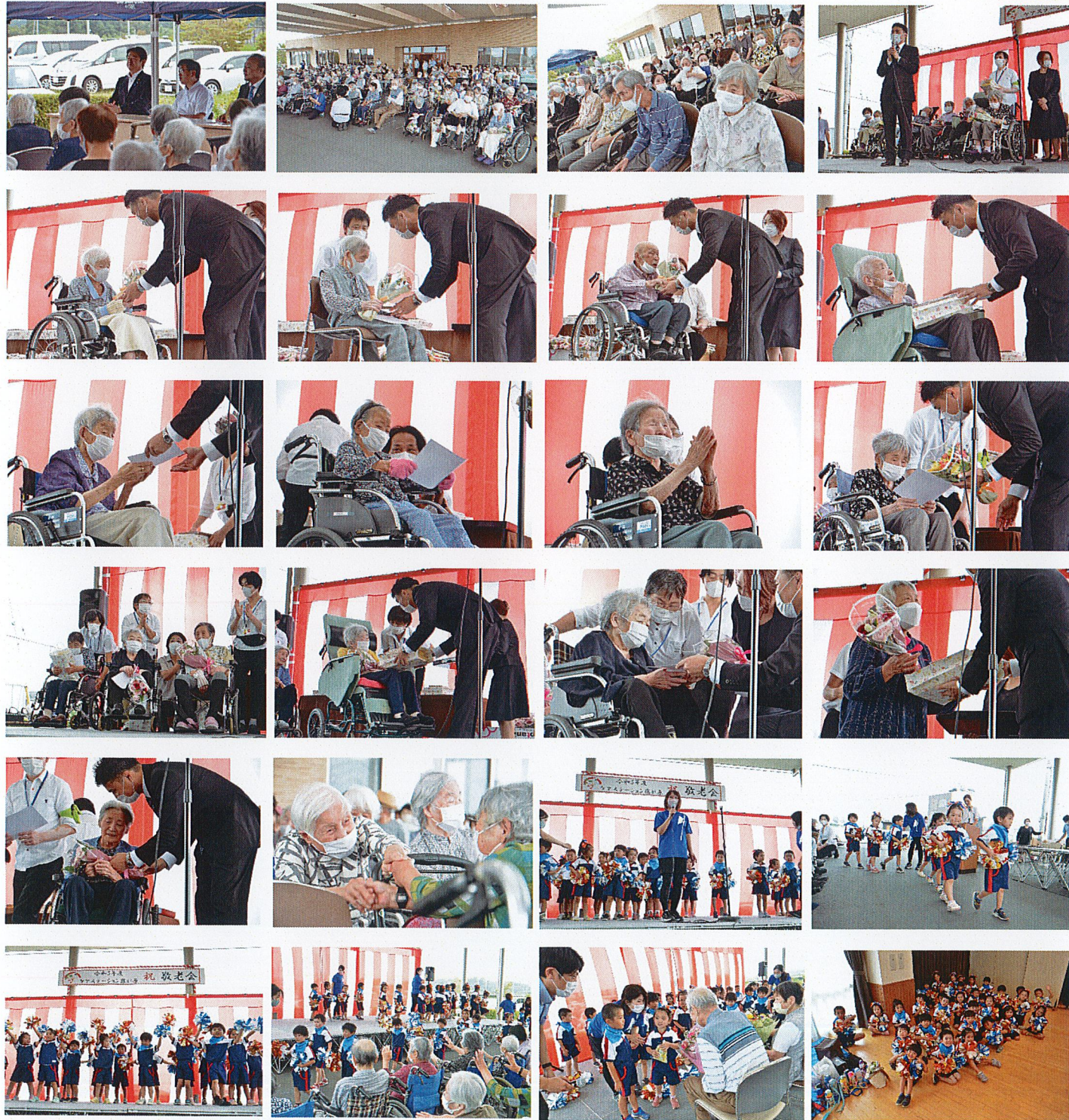
皆様のご長寿を心よりお祝い申し上げます。また、参加していただいたご家族、ご来賓の皆様、会場を盛り上げてくれた千波保育園の皆様、ありがとうございました。